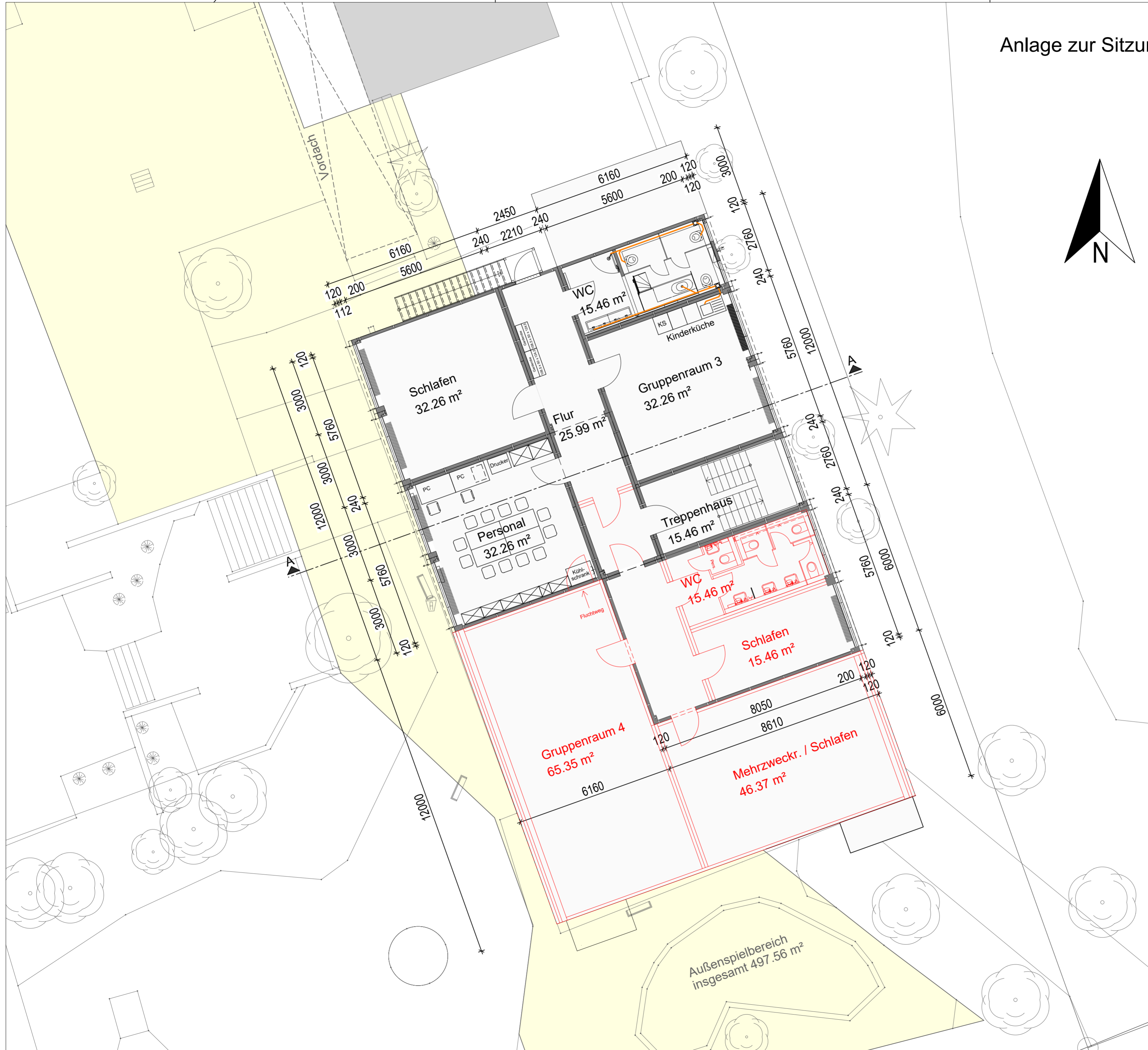
Variante 3 Erweiterung Kita an der Friedensschule im OG